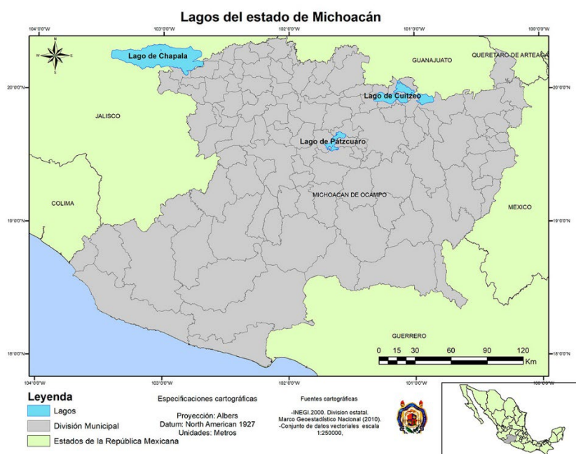
Figura 1 Ubicación e información general de los tres lagos más grandes de México.