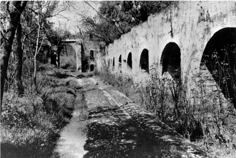
Foto 2. Ruinas del acueducto de La Escoba, Archivo personal de Federico de la Torre.