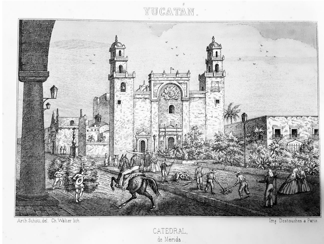
Figura 1. Litografía de la Catedral de Mérida. Sin fecha