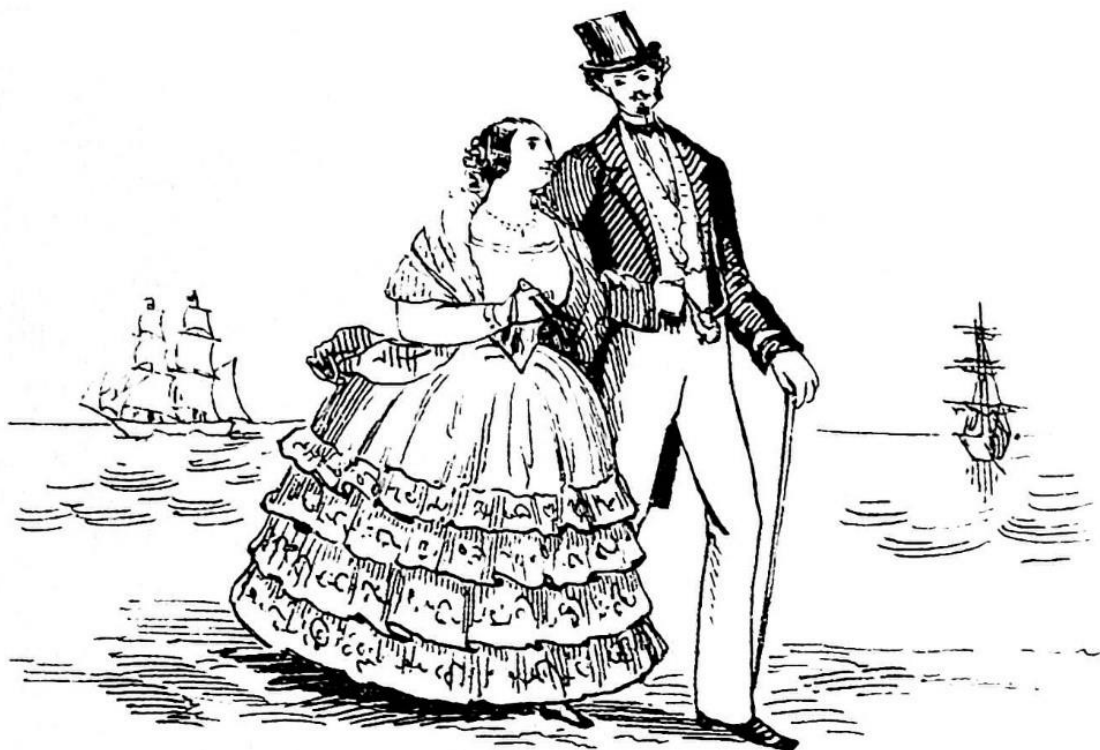
Figura 4. “Después de la pesca”