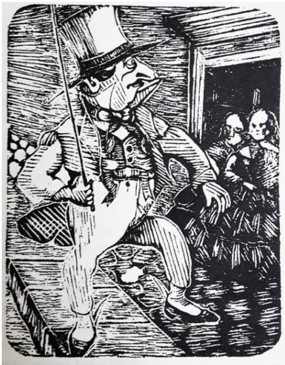
Figura 2. José Dolores Espinosa. “Caricatura de Pascual Abecerrado”